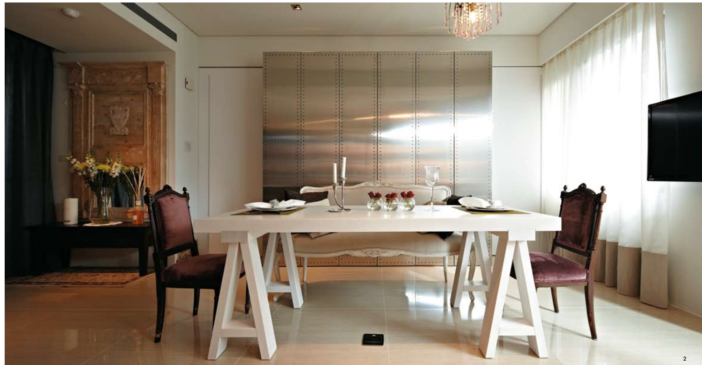
01.沙發背牆一開放式的收納櫃體作為沙發背牆，其分界的層板以1/3及2/2比例切割，讓空間增添了律動感。02.餐廳主題一設計師構置一整面的金屬感的鉚釘櫃，除了增加機能性，也讓空間的時尚主題加分。03.端景牆一屋主特地從威尼斯帶回來的立體掛畫，讓甫入門就營造出藝文質感的氛圍。04.動線規劃一重新統整佈局，翻轉空間中的動線，將主臥與客臥的門口設置於餐廳面牆的兩側。05.廚房一原裝進口的整套廚具，擁有最完備的機能，是屋主招待親友的小天地。